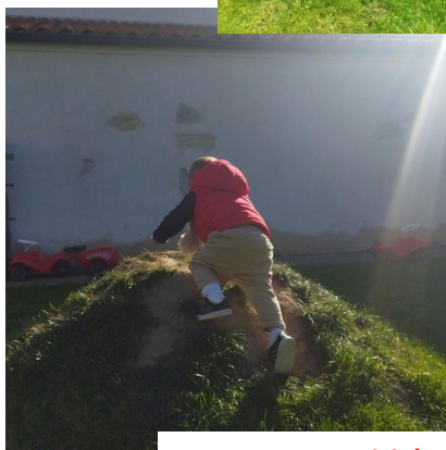
Les espaces motricité